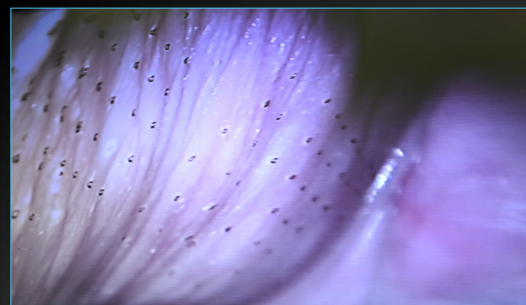
Cara Lateral de la Vagina Post Laser